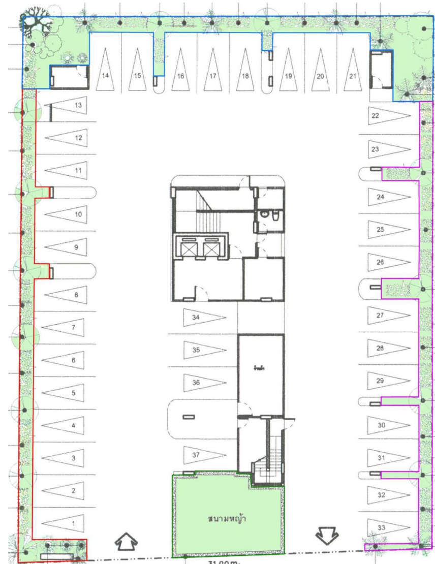
ภาพที่ 3 ผังพื้นที่สีเขียวชั้นล่าง